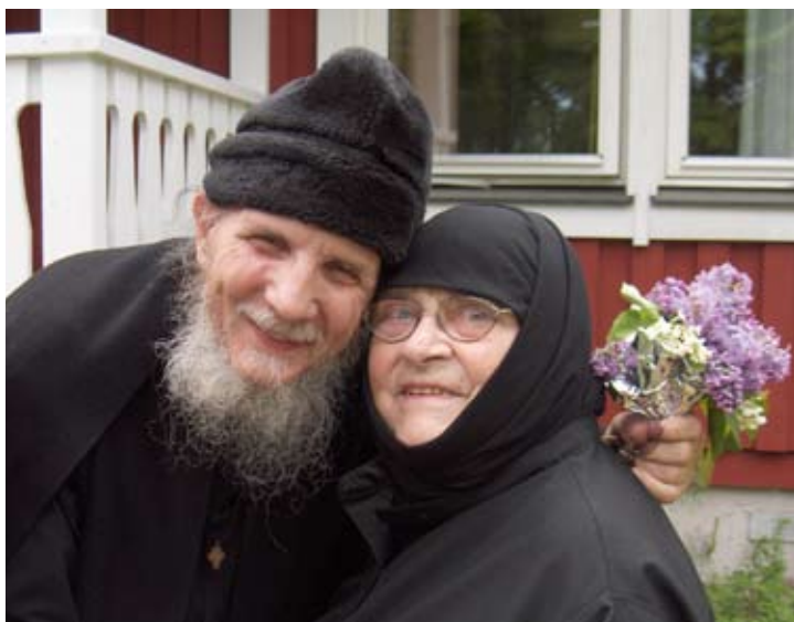
Biskop Kyprianos och Moder Philothei