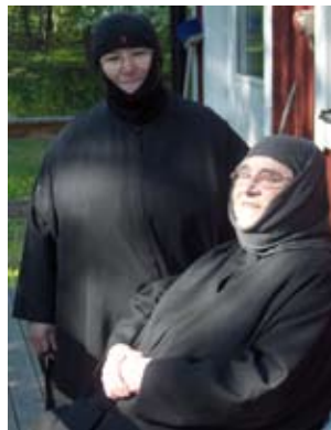
Moder Taxiarchia och Moder Philothei

Vi fick ha några intensiva dagar dagar med djup andlig lärdom tillsammans med Biskop Kyprianos och delegationen och längtar till att de ska komma tillbaka nästa år.