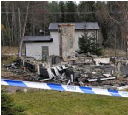
Branden tog hela munkboningen