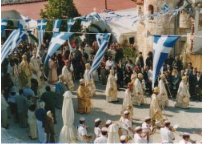
Heliga Kyprianos och Justinas festdag i Fili oktober 2001