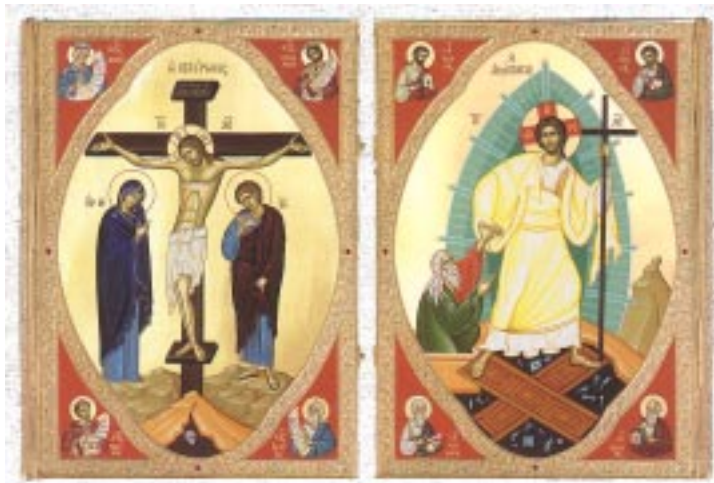
Detta handmålade evangelium är en gåva från brödrskapet vid Heliga Kyprianos och Justina kloster till vår metropolit på hennes namnsdag 2001.