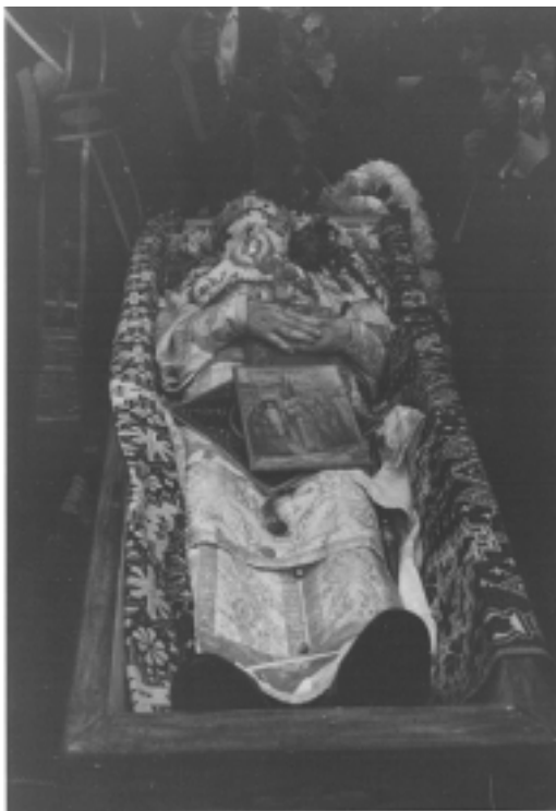
Den välsignade Metropolit Glicherie i kistan vid begravningen den 19 juni/2 juli 1985