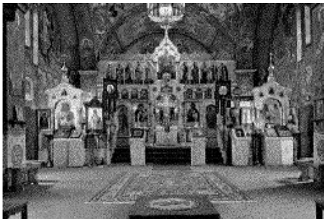
Katedralens interiör vid Heliga Treenighetens kloster, Jordanville