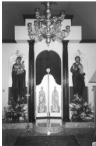
Extriör och interiör av den Helige Johannes (Maximovitch) kapell