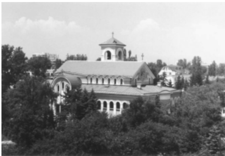
Gudaföderskans avsomnande, Sofia Bulgarien

fira gudstjänst. Ett av de stora nunneklostren ”Under Gudaföderskans beskydd” uteslöts ur patriarkatet och dess huvudkyrka, tillägnad den Hl. Lukas, konfiskerades. Redan från början stöddes och uppmuntrades gammalkalendarikerna av den Välsignade Arkimandriten Justin (Popovich) från den Serbisk-ortodoxa kyrkan. 1981 besökte nästan hela vår synod av biskopar den bulgariska systerkyrkan. Efter den splittring som ägde rum inom vår kyrka, rörande nykalendarikernas status, så var våra bulgariska bröder hela tiden lojala mot vår synod. Så småningom beslöt så vår synod att i hemlighet viga präster till våra bulgariska bröder. Biskop Photii vigdes till präst 1988, något som inte ens hans föräldrar visste något om. När sedan den kommunistiska regimen föll så skedde ingen förändring inom det Bulgariska patriarkatet, vilket gammalkalendarikerna, som nu kunde komma upp ur katakomberna, hade hoppats på. Istället blev det en schism som resulterade i två rivaliserande patriarker, som först under hösten 1998 har upphört genom påtryckningar från den ekumeniske patriarken och ett s.k. pan-ortodoxt möte i Sofia. När så ingen föänding kom till stånd vände sig gammalkalendarikerna till vår synod och bad oss att upphöja prästmunken Photii (Siromahov) till biskop. Detta skedde så småningom den 4/17 januari 1993 i de Heliga Kyprianos och Justina kloster, Fili, Grekland av två biskopar från vår synod och en från vår rumänska systerkyrka.