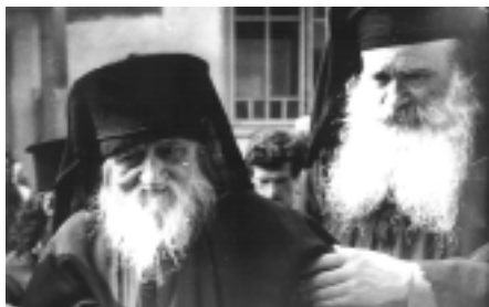
Metropolit Glicherie (t.v.) med Biskop Silvester (t.h.)