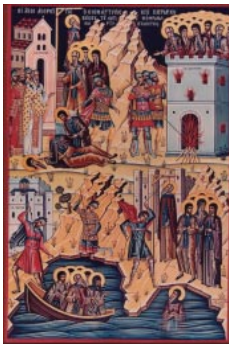
Heliga martyrer för den ortodoxa tron från det Heliga Berget (Athos)