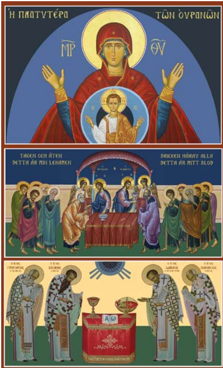
Under sommaren 2008 fullbordades absiden i vårt kapell i Uppsala