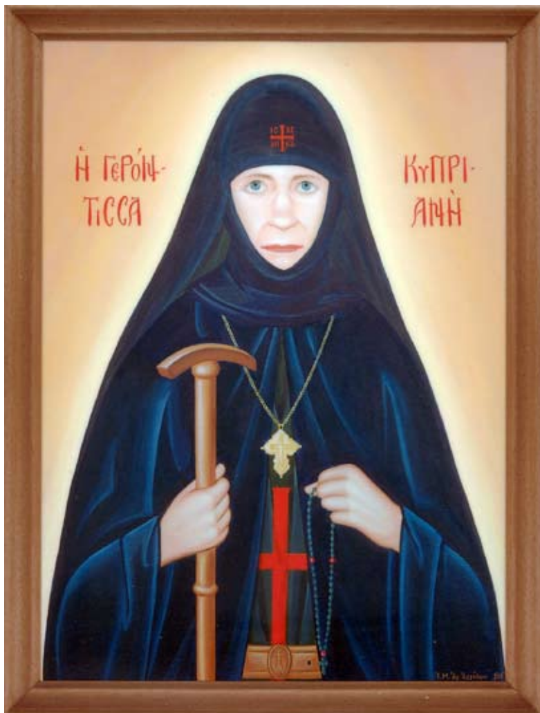
Porträtt av den i evighet ihågkommelse värda Moder Kyprianē från Heliga Änglars kloster, Afidnai (Grekland)

Utgiven med välsignelse från H.E. Metropolitanen Kyprianos av Oropos och Fili Årgång 20 2008