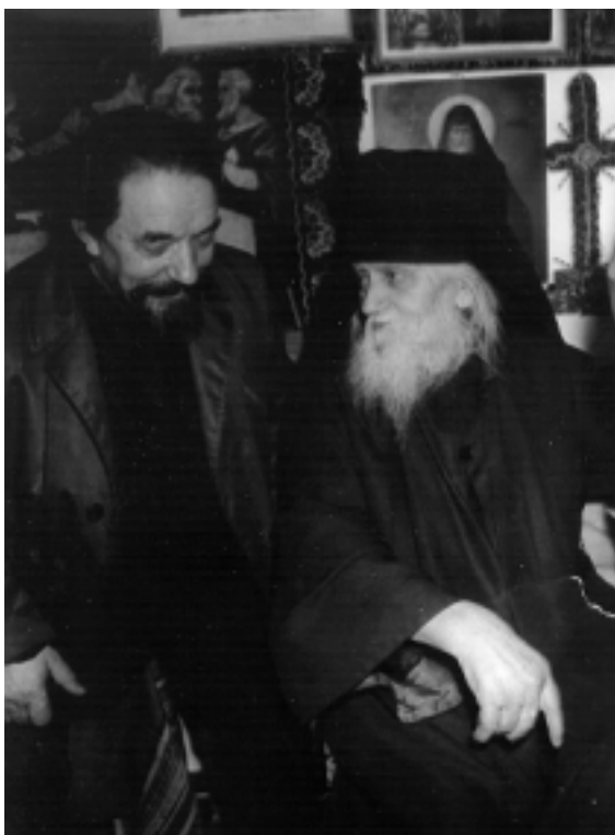
Biskop Demosten med den Helige Glicherie på Ortodoxins söndag 1981

1960 kom en representant från Religionsministeriet tillsammans med tre officerare från Securitate , dvs. den beryktade hemliga polisen, till Slatioara. De befälde Vladika Glicherie att sända bort alla munkarna från klostret. Han