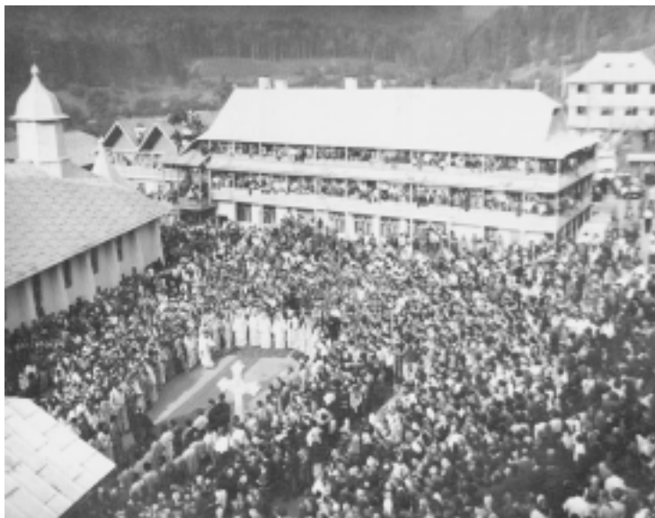
Kristi förklaringskloster, Slatioara, under den Gudomliga liturgin och delar av de ca 20.000 som kommit för att delta i helgonförklaringen.