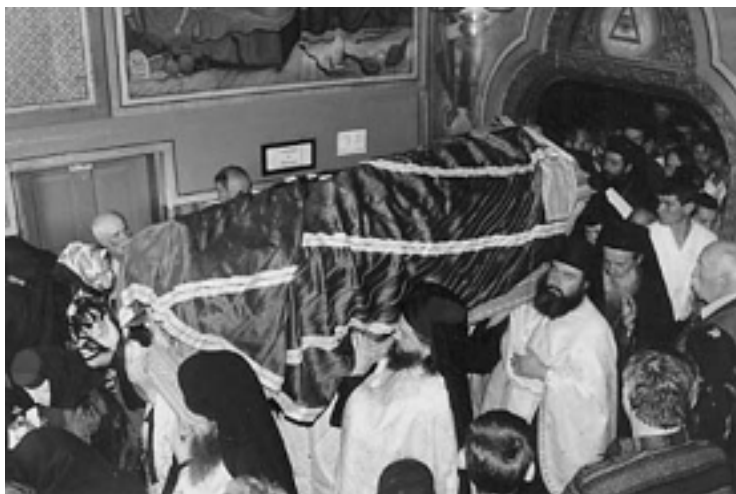
Kistan med den Helige Glicheries relikers bärs i procession från sin plats i kyrkan till den öppna platsen på klostergården. Runt kistan är helgonets biskopliga mantel, Mandyas, svept.