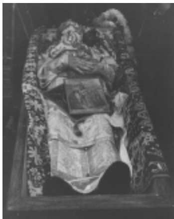
Den välsignade Metropolit Glicherie i kistan vid begravningen den 19juni/2 juli 1985

Under Metropolit Silvestrus ledning och efter Ceaucescus fall, i och med revolutionen 1989, kunde gammalkalendarikerna fortsätta sitt arbete utan att hotas av direkt förföljelse. Den nya staten erkände den såsom en institution och de fick lagliga rättigheter. Staten har också lovat att göra, som den grekiska staten gjort, att erkänna dem som en ortodox kanonisk kyrka, men så har ännu inte skett. Sedan revolutionen 1989 har ändå mer än 60 nya kyrkor kunnat byggas. Metropolit Silvestru insomnade dock hastigt i april 1992 och den nuvarande primas Vlasie blev Metropolit. Han har som sin kyrkas överhuvud kunnat resa utomlands och representera sin kyrka vid ett flertal viktiga händelser, som t.ex. vid helgonförklaringen av den Helige Johannes av Shanghai och San Francisco. Han var i Sverige i augusti 1998 för att tillsammans med en annan rumänsk biskop delta vid konsekrationen av de Heliga Konstantin och Helena ortodoxa kyrka, Värberg, Stockholm.