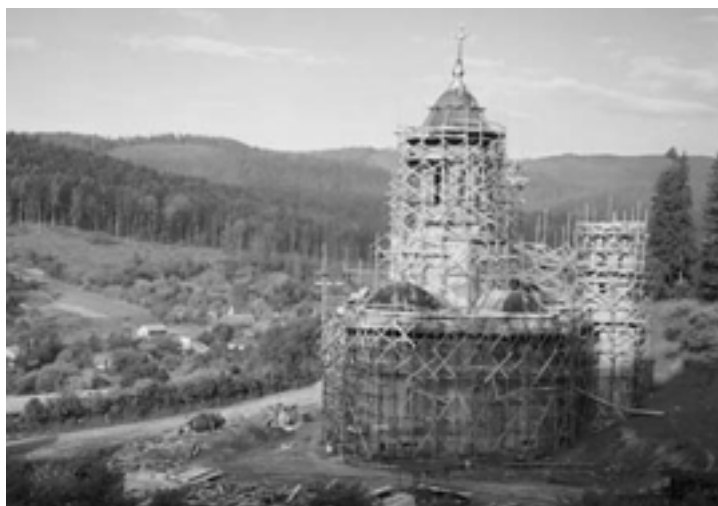
Den nya katedralen i Slatioara, som beräknas kunna rymma ca 2000. Mittentornet är 45 meter högt.