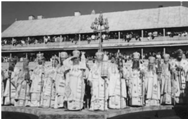
Från vänster till höger: Biskop Ambrosios, Biskop Chrysostomos (Australien), Biskop Symeon (Österrike), Biskop Angelos (Grekland), Biskop Photii (Bulgarien), Metropolit Vlasie (Rumänien), Metropolit Kyprianos (Grekland), Biskop Demosten (Rumänien), Ärkebiskop Chrysostomos (USA), Biskop Ghenadie (Rumänien), Biskop Michael (Italien) och Biskop Auxentios (USA). På bilden syns inte de rumänska biskoparna Pahomie, Sofronie och Theodosie.