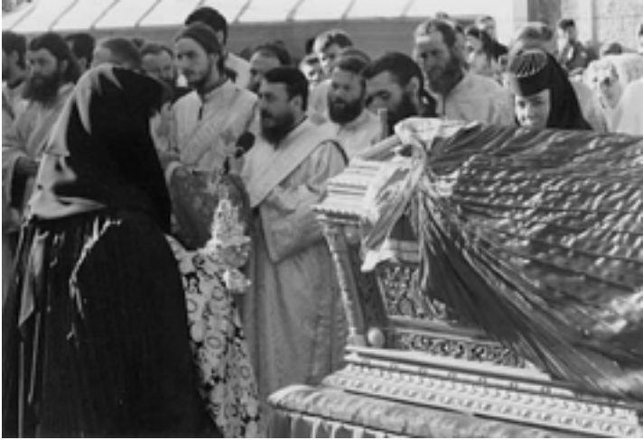
Ovan, de Heliga relikerna berökta med rökelse av nunnor.