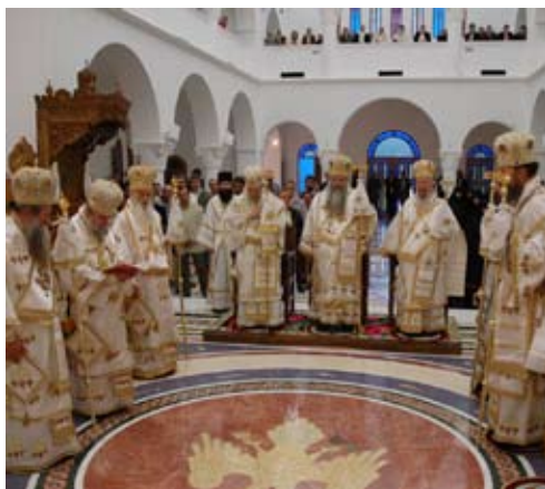
Alla biskopar samlade för liturgi