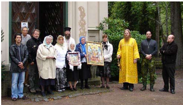
Festdag i Uppsala till minne av Theotokos avsomnande