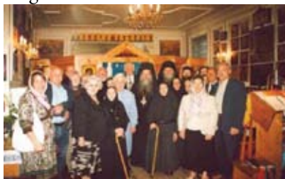
Convent of the Annunciation of the Theotokos, London

”Theotokos bebådelses nunnekloster” i London grundades med välsignelse från Helige Johannes av Shanghai och San Fransisco 1954. Klostret har sitt ursprung i det Heliga landet. Nunneklostrets abbedissa fick tillsammans med en grupp nunnor fly från klostret under det arab-israeliska kriget 1948. Nunnorna fick genomgå svåra lidanden i sin exil i sex år. Efter två år av gästfrihet i Lesna-klostret i Frankrike kom de genom Guds försyn till England.