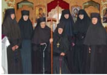
Systraskapet vid vid Holy Protection i Canada