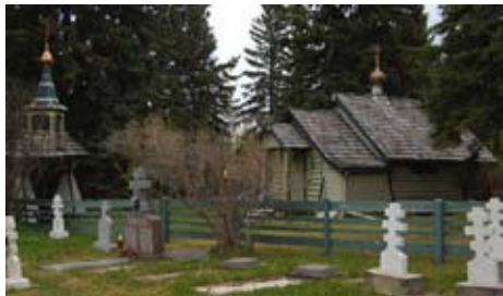
Holy Protection Convent i Canada

I USA har vår synod under åren lånat ut ett antal präster för tjänstgöring i kyrkor under den Ryska utlandskyrkan. De flesta har nu med välsignelse från den Ryska utlandskyrkan återvänt till vår synod. Förutom detta har en församling i Kalifornien övergått till vår synod. Församlingen saknade präst och betjänas nu av präster från vårt amerikanska exarkat. En präst i San Diego har lämnat sin tjänst i Ryska utlandskyrkan och kommer att leda en församling under vår synod i samma stad. En diakon från den livaktiga ryska församlingen i Rochester har kommit till vår synod och prästvigdes kort därefter och kommer leda en församling där. Slutligen har ett av Ryska utlandskyrkans nunnekloster i Bluffton, Canada, "Gudsmoderns beskydd" ställt sig under vår synod.