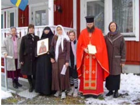
Traditionsenlig procession runt klostret med ikonen på Heliga Philotheis dag.