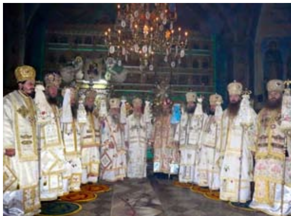
Den rumänska biskopssynoden

Den 4, 5 och 6 november 2007 (gamla stilen) vigde vår rumänska systerkyrka tre nya biskopar för att stärka sin kyrkliga struktur och betjäna sina mellan 600.000-1.000.000 troende. Vigningarna ägde rum vid synodens kloster Kristi förklaring i Slatioara där förste hierarken Vlasiu residerar. Prästmunken Glykerios konsekreerades till biskop av Iasi, prästmunken Dionisie till biskop av Galati och prästmunk Evloghie till biskop av Sibiu.