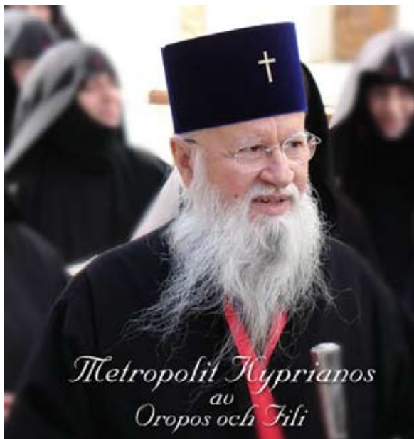
Metropoliten på besök till Heliga Änglars kloster i oktober 2007