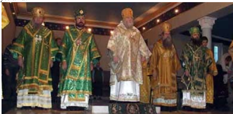
Liturgi i Odessa dagen efter de två biskopsvigningarna