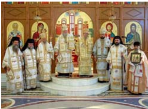
Sex av våra biskopar koncelebrerar med Biskop Agathangel från den Ryska utlandskyrkan i Fili

nerade ett gemensamt dokument "Memorandum Regarding Principles of Cooperation Between the Greek and Russian Anti-Ecumenists" och den permanenta synoden utlovade att skicka två biskopar till Odessa för att delta i konsekration av nya biskopar för Biskop Agathangel så att deras hierarkiska struktur kan stärkas. Alla dokument om mötet finns på vår synods hemsida www.synodinresistance.org .