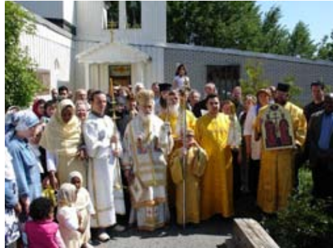
Firandet av de apostaliska Konstantin och Helena. Efter den Gudomliga li- turgin blev det procession med festikonen.