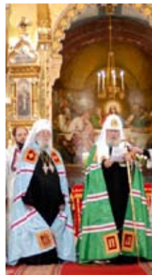
Metropolit Lavr och Patriark Alexej av Moskva