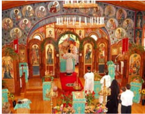
Panoramabild från den ryska kyrkan i Oxnard