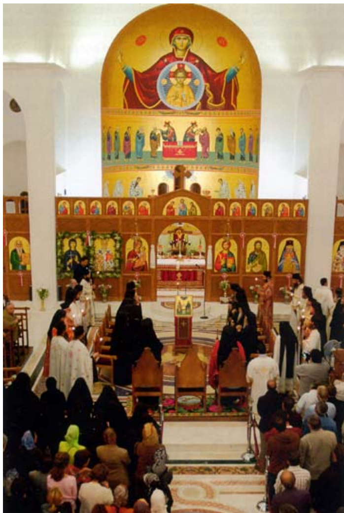
Intriör från den nya katedralen i Fili

sådan officiell lista ska publiceras och uppdateras på synodens hemsida.